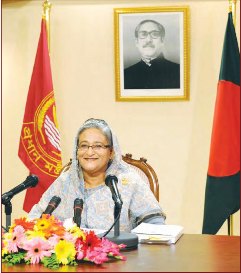
গণপ্রজাতন্ত্রী বাংলাদেশ সরকারের মাননীয় প্রধানমন্ত্রী শেখ হাসিনা